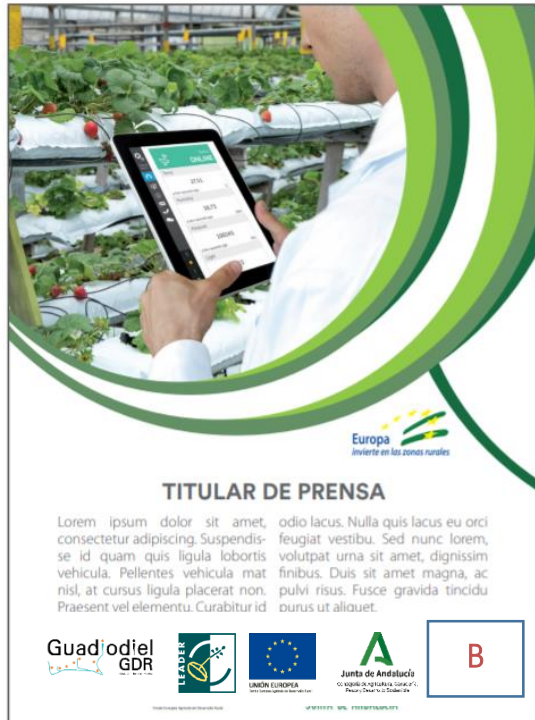
Anuncio en prensa