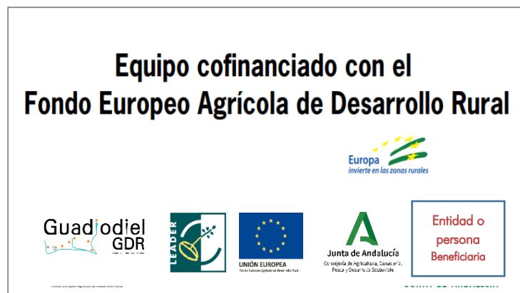
Proporción recomendada 16/9

El tamaño será acorde al objeto en cuestión y siempre en la proporción 16x9.